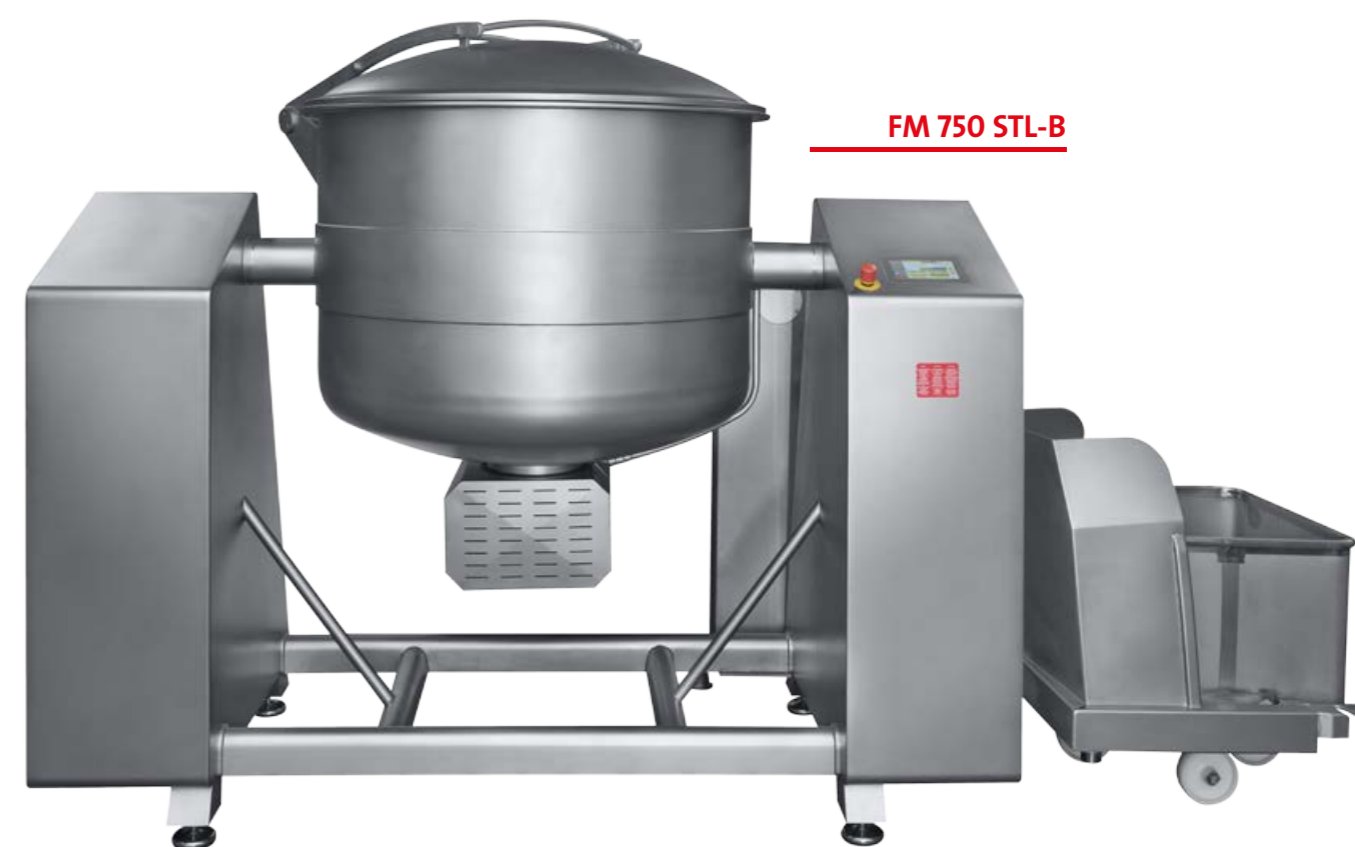
FM 750 STL-B