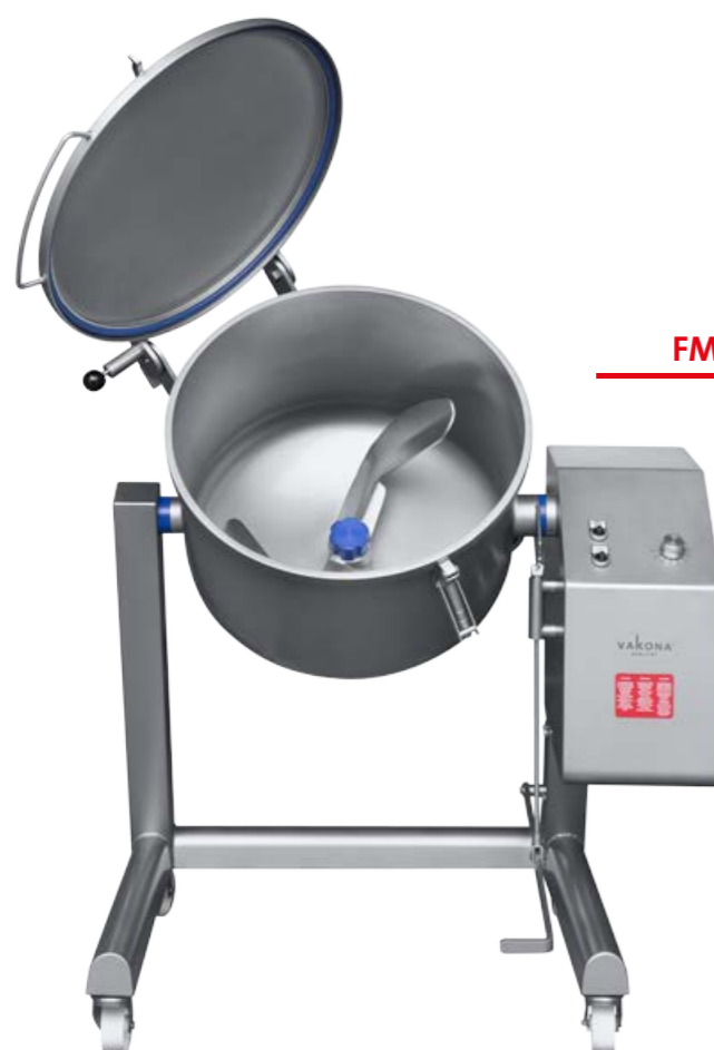
FM 100 STL